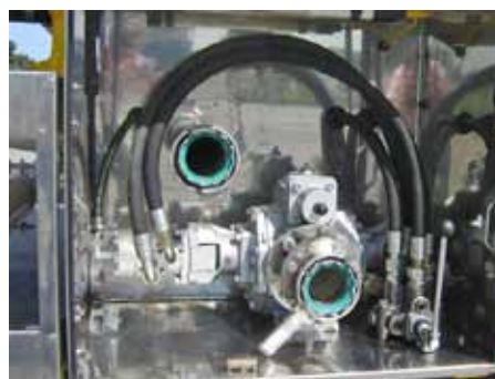
PUMPPRINCIP SJÄLVSUGANDE LAMELLPUMP